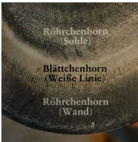
Abb. 9: Huf und Fesselstand,