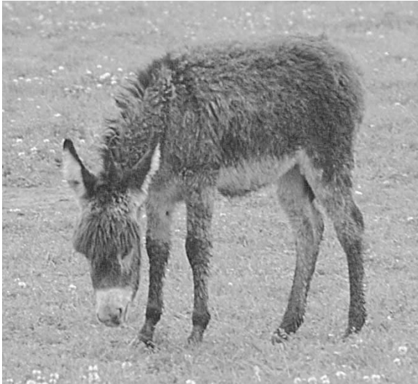
Abb. 5: Das flauschige Fohlenfell saugt sich wie ein Schwamm voll Wasser, wenn das Fohlen nass wird. Leicht kann eine lebensbedrohliche Lungenentzündung die Folge sein.