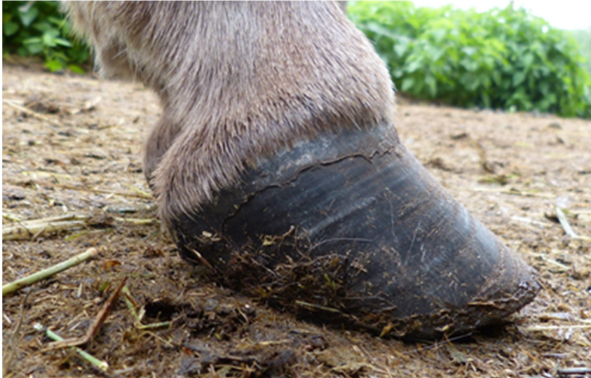
Abb. 6: Esel mit vernachlässigter Hufkorrektur

Ausreichende Bewegung ist für die Erhaltung der Hufgesundheit unerlässlich.