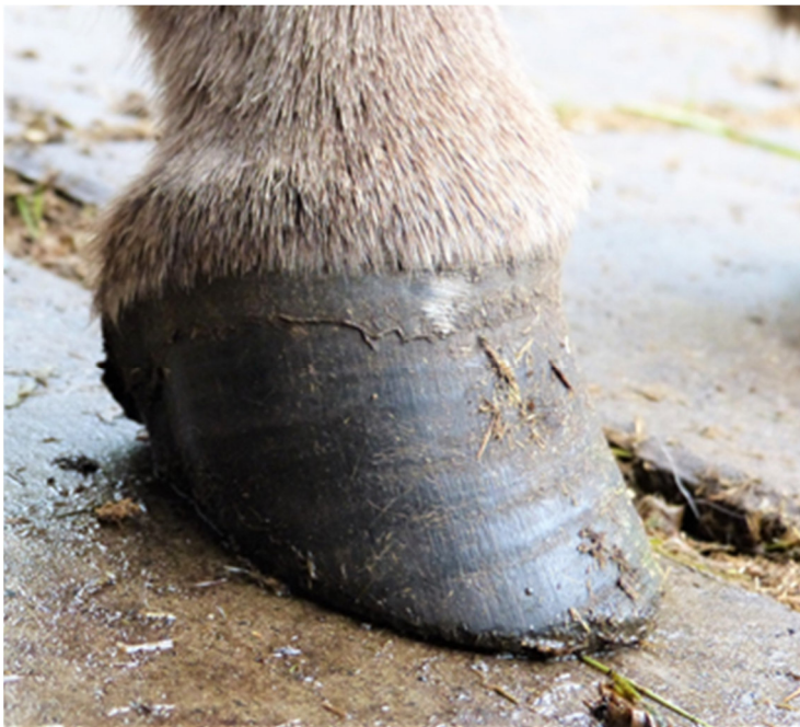
Abb. 7: Korrekte Hufstellung nach Hufpflege