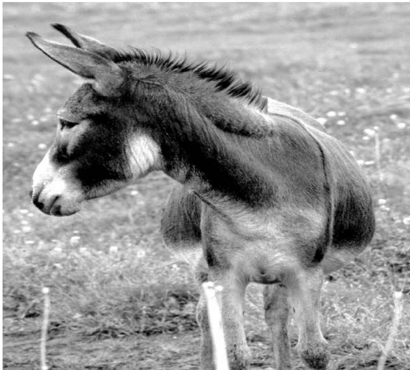
Abb. 3: Bei diesem Esel ist die Einlagerung von Fett in das Bindegewebe am Hals gut zu erkennen, auch wenn der Hals noch nicht „gekippt“ ist. Die üppige Kleeweide im Hintergrund dürfte die Ursache für das Übergewicht sein.

Übergewichtige Esel neigen zu Hufveränderungen und Lebererkrankungen. In Deutschland leiden Esel weit häufiger an Über- als an Unterernährung. Die Mehrzahl der Tiere weist bspw. eine unregelmäßige Hufbeschaffenheit als Folge von Energie- und Proteinüberschüssen in der Fütterung auf (siehe hierzu auch Kapitel 8.3 Hufpflege). Typische Stellen für Fetteinlagerungen sind der Hals, der sich dadurch zum „Kipphals“ entwickelt und die Lendenregion. Ein hoher Anteil an Bindegewebe in den Fettdepots, der auch nach einem Fettabbau bestehen bleibt, ist für Esel typisch.