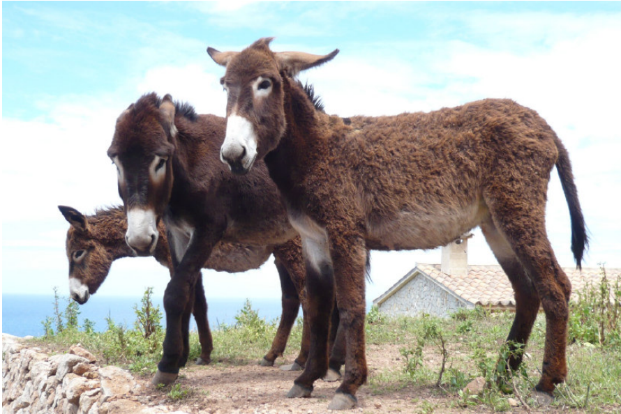
Abb. 2: Esel zeigen eine auffällige Mimik und Körpersprache