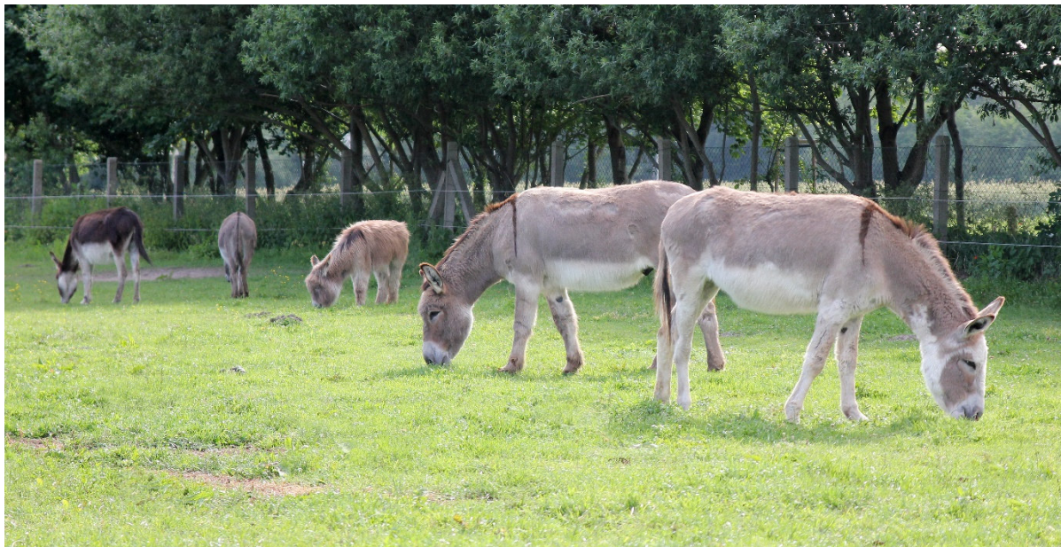
Abb. 1: Eine Vielzahl verschiedener „Eseltypen“ und Farbvarianten kann in Deutschland angetroffen werden

Der züchterische Einfluss auf die heutige Eselpopulation ist unverkennbar. Die meisten Esel haben ein Stockmaß zwischen 95 bis 115 cm. Für Großesel, wie den Baudet du Poitou, ist ein Stockmaß im Mittel von 145 cm („Hengste von 140 bis 150 cm“) im Zuchtstandard festgeschrieben.