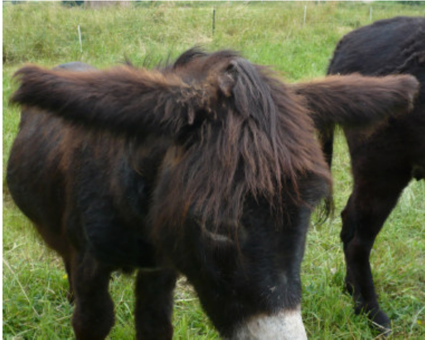
Abb. 8 Helikopterohren

Esel sind von ihrem Naturell her eher duldsam und stoisch. Krankheitssymptome und Schmerzen zeigen sie weniger deutlich als zum Beispiel Pferde. Typisches Ausdrucksverhalten eines kranken Esels sind die hängenden Ohren („Helikopterohren“). Oft werden Schmerzzeichen als „störrisch“ fehlinterpretiert. Deswegen ist oftmals eine frühzeitige Hinzuziehung eines Tierarztes/einer Tierärztin dringend anzuraten.